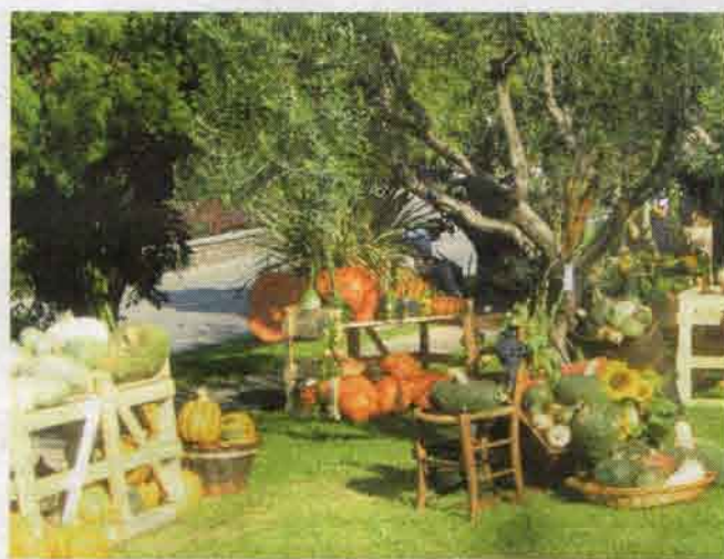
Scorcio della Festa della Zucca, durante una passata edizione

La più originale era una grossa zucca scavata, con all'interno un presepio di bellissime statui-