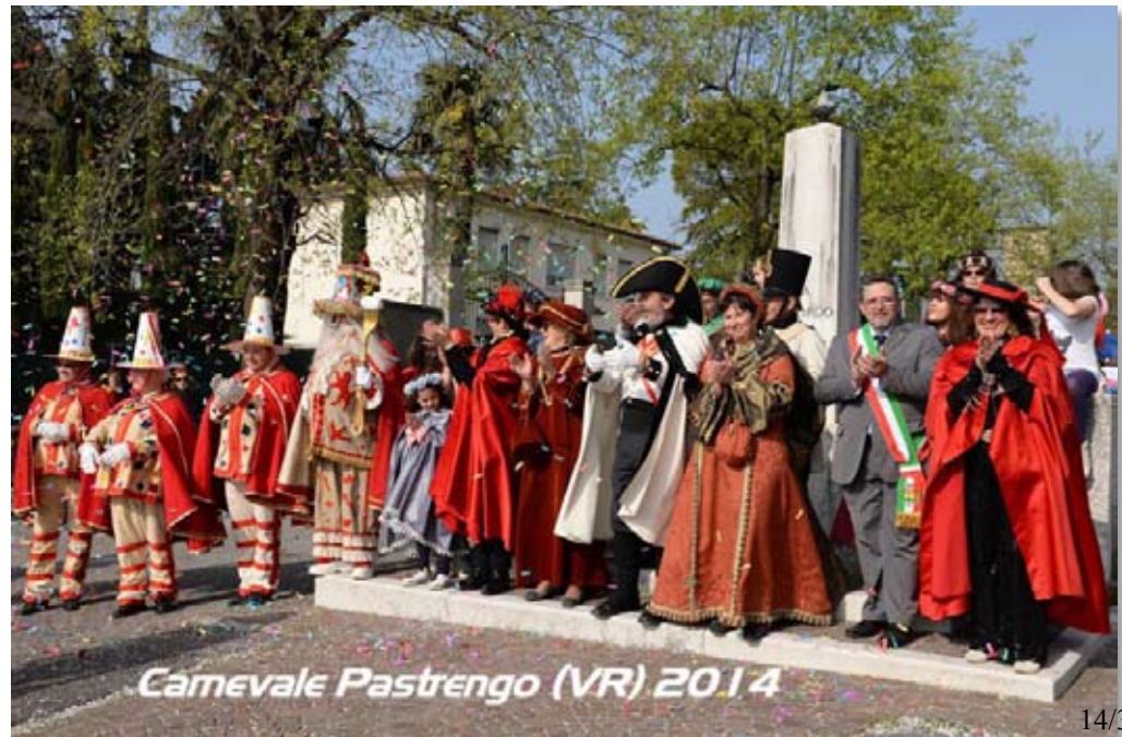
Carnevale Pastrengo (VR) 2014