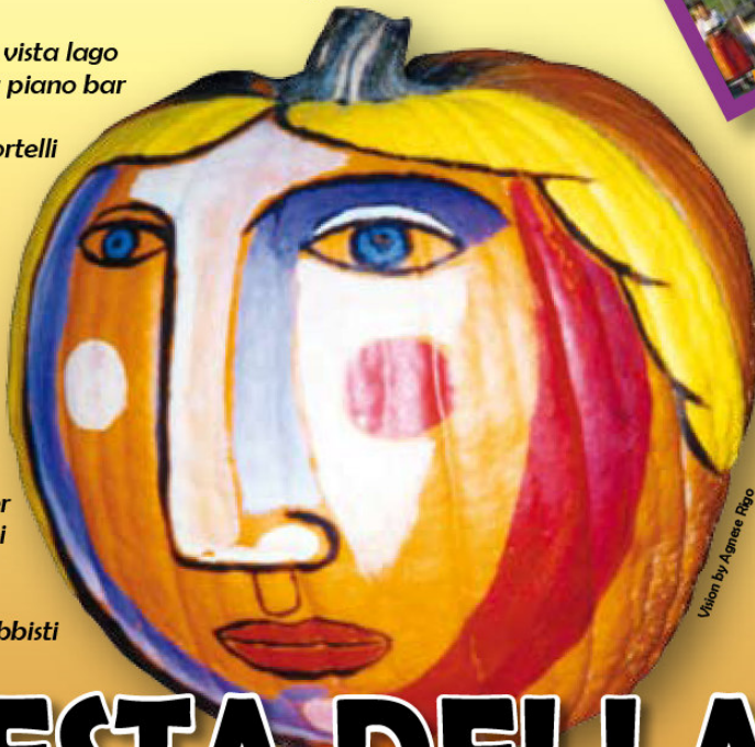
Vision by Agnese Rigo