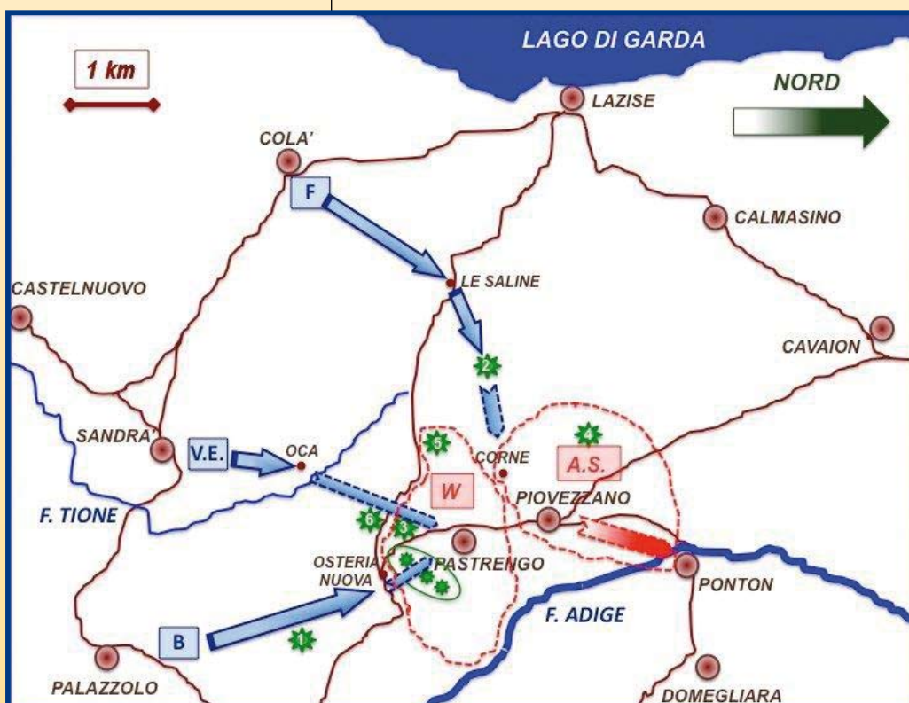
Elaborazione schema battaglia del Gen. Franco Apicella.

Il giorno 29 Carlo Alberto, re di Sardegna, decide d'impossessarsi delle alture attorno a Pastrengo, allo scopo di assicurare il fianco sinistro dello schieramento e di chiudere agli austriaci la via di comunicazione della Val d'Adige.