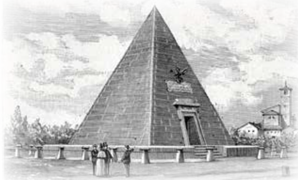
Foto dei primi anni del 1900: il sacrario-ossario dei caduti alla battaglia di Novara del 23 marzo 1849